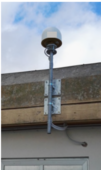
Figura 2 – Esempio di installazione di una stazione GNSS