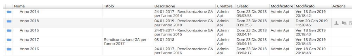
Figura 4: informazioni documenti

L’interfaccia browser mostra le etichette dei dettagli di ogni documento inserito nel portale come nella figura sopra riportata, nello specifico si possono visualizzare informazioni dettagliate che vanno dal nome del creatore alla data di creazione o di ultima modifica di un documento.