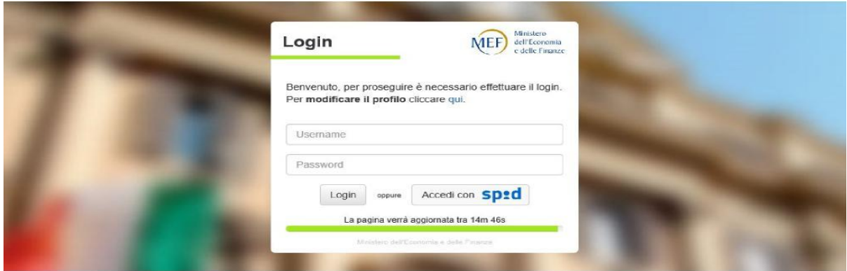
Figura 1: la pagina di accesso con le varie opzioni

Il sistema è profilato a seconda della tipologia di utenza e alcune caratteristiche possono essere o non essere disponibili.