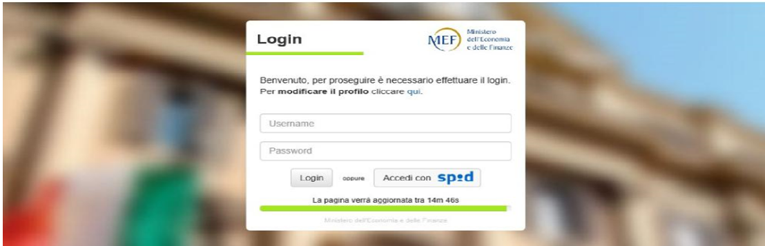
Il sistema è profilato a seconda della tipologia di utenza e alcune caratteristiche possono essere o non essere disponibili.

Il browser al riavvio ricorderà le impostazioni personalizzate dell'utente configurando le schermate del portale.